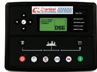
TABLEAU DE COMMANDE DIGITAL