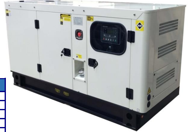
VERSION CAPOTE INSONORISE