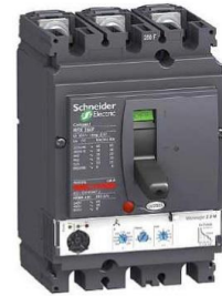
DISJONCTEUR DE PROTECTION