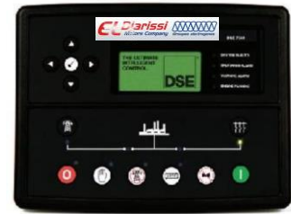
TABLEAU DE COMMANDE DIGITAL