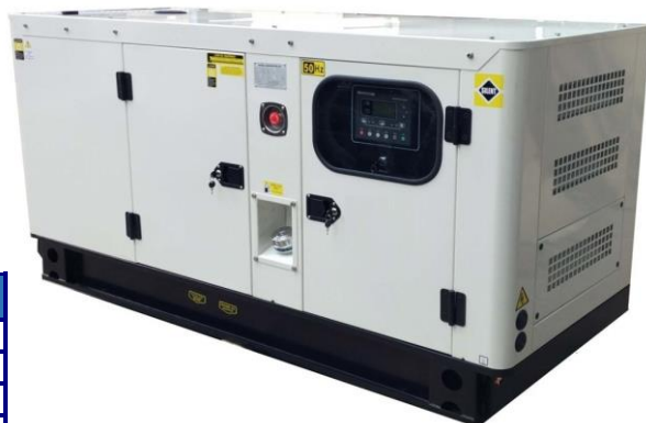
VERSION CAPOTE INSONORISE