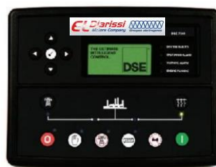
TABLEAU DE COMMANDE DIGITAL