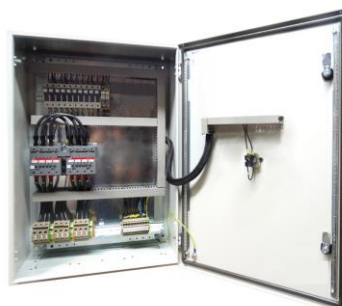
INVERSEUR DE SECOURS