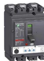
DISJONCTEUR DE PROTECTION