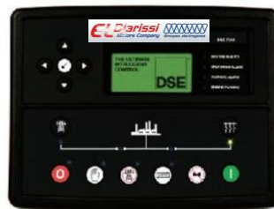
TABLEAU DE COMMANDE DIGITAL