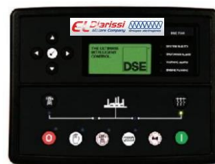
TABLEAU DE COMMANDE DIGITAL